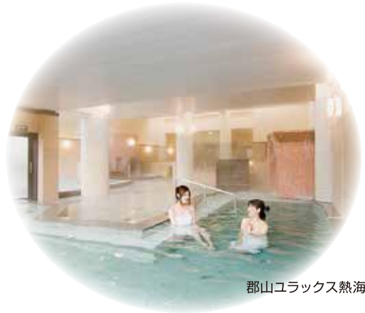
郡山ユラックス熱海