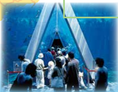
アクアマリンふくしま (いわきエリア)