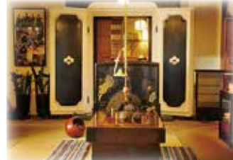
いろいろの宿 芦名