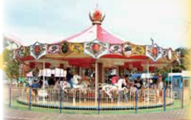
郡山カルチャーパーク (郡山エリア)