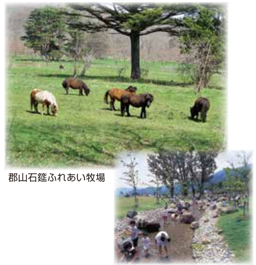
郡山石筵ふれあい牧場