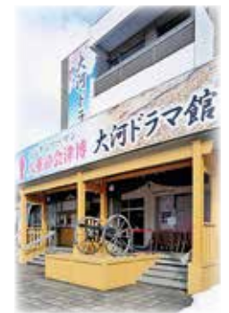
八重と会津博大河ドラマ館