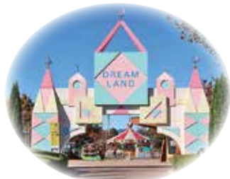
郡山カルチャーパーク