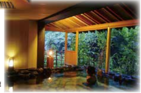
会津東山温泉 原瀧