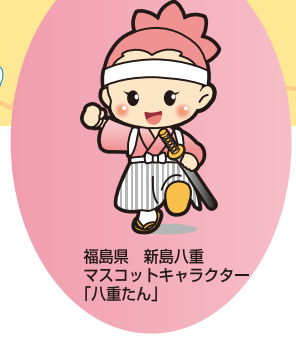
福島県 新島八重 マスコットキャラクター 「八重たん」