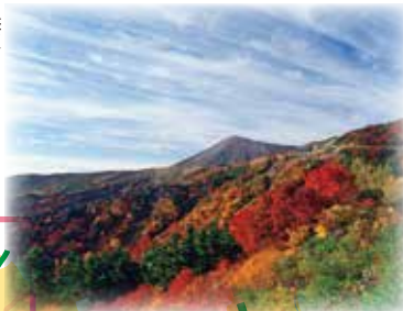
磐梯吾妻 スカイライン (県北エリア)