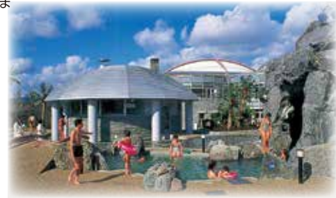
スパリゾートハワイアンズ