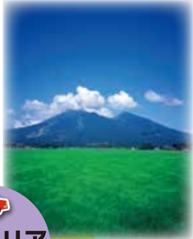
磐梯山(会津エリア)