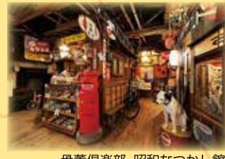
骨董倶楽部 昭和なつかし館