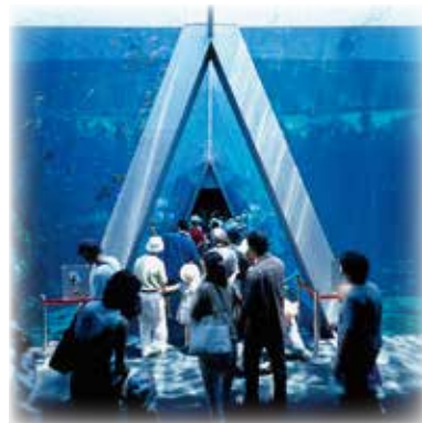
アクアマリンふくしま