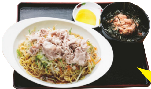
冷たいラーメンセット ¥850

品もあるので試してみてください。ニセコ町「高橋牧場」のソフトクリームや飲むヨーグルト、小樽「銀の鐘」のスイーツ各種といった後志みやげのほか、最近では、すすきの洋菓子店「グランベークイケハタ」の商品も、ロールケーキにタルト、クッキーと充実。ドライブ途中のティータイムに、甘いものが食べたい人にも好評だ。