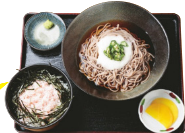
冷たいそばセット ¥800

口当たりのよいそばが、トロ口とオクラでさらに喉越しよく楽しめます。ほぐし身をたっぷりのせたミニカニ丼どうぞ