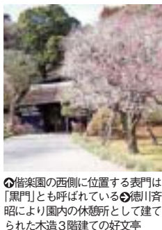
◆偕楽園の西側に位置する表門は「黒門」とも呼ばれている徳川斎昭により園内の休憩所として建てられた木造3階建ての好文亭