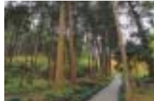
②樹齢約300年の熊野杉は光圀公が熊野から運ばせたもの ③母屋の前には光圀公が愛した梅(好文木)が植えられている