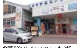
◎国道沿いにありアクセスも良好