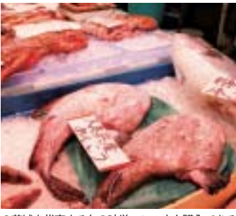
◎茨城を代表する冬の味覚アンコウも購入できる ◎センター内の鮮魚店には地元漁港で水揚げされた新鮮な魚介類がズラリと並び、旬の味覚を安価に購入できると好評だ(鮮魚等は時価)