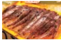
◎地元味覚の一つメヒカリも人気だ