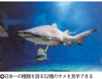
◎日本一の種類を誇る52種のサメを見学できる