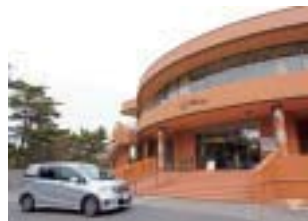
⑧地下1300mから湧く良質の湯が人気だ