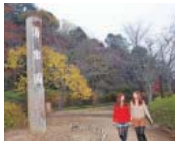
◆広大な約13haの園内の東側に梅林が広がる