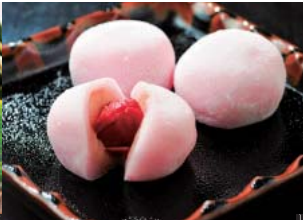
1 五條製菓の「梅干し大福」 2 元祖なべやの「粽」 3 菓子の司 木村屋本店の「水戸の梅」 4 パティスリー-KOSAIの「茨城の焼栗」 5 大丸屋の「おいしいジェラート」(芋〜のみつき芋)