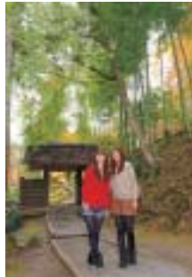
①趣ある通用門をくぐると西山荘へと続く庭園が広がる