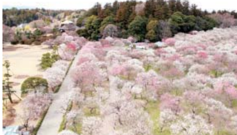
◆偕楽園は西側に位置する杉林が陰の世界、北東の梅林が陽の世界を表し、園全体で陰と陽の世界を表している

TOPICS 116回目を迎える歴史ある梅まつり2/18④～3/31④までの期間、水戸の梅まつりを開催。期間中の週末には偕楽園内で野点茶会や野外琴の会などのイベントが催され、例年多くの人でにぎわう