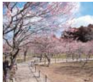
◆多様な品種の梅があり長期間、楽しめる

今回は見ごろを迎える梅と旬の味覚、アノコウを味わいに新春の常陸路へ。最初に訪れる梅の名所「偕楽園」へは、常磐道・水戸ICより約10km。例年2月中旬から見ごろを迎える園内の梅は約100種類、3000本にも及び。広大な園内の梅の花見を楽しんだあとは、海沿いの街、大洗へ。昼食は鮮魚店が営む食事処「ちゅう心」で、旬の味覚アノコウ鍋に舌鼓を打つ。食後は「アクアワールド茨城県大洗水族館」で、