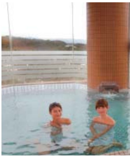
⑥ナトリウム硫酸塩塩化物泉の湯は神経痛や疲労回復に効果があり体の芯から温まる