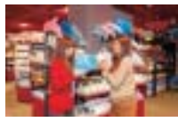
◎オリジナルグッズなどがそろったショップもある