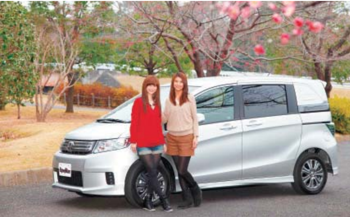
◆梅の名所「偕楽園」での観梅をはじめ、光園公の隠居所などの史跡、新鮮な海産物が味わえるグルメなど、魅力あふれるスポットが点在している