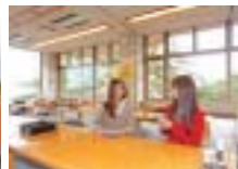
⑨座敷の大広間をはじめ、ゆっくりくつろげるラウンジも ⑩日本の白砂青松百選に選ばれている伊師浜を望む露天風呂

農産物直売コーナーで新鮮野菜をおみやげ品などをそろえる館内の売店では、農産物直売コーナーを設けている。地元農家の新鮮な野菜を購入できると好評。おみやげ用にもおすすめです。