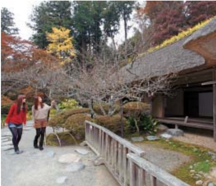
取材協力:公益財団法人 徳川ミュージアム 西山荘