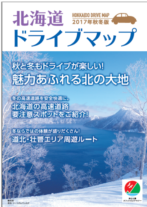
< 表紙 >