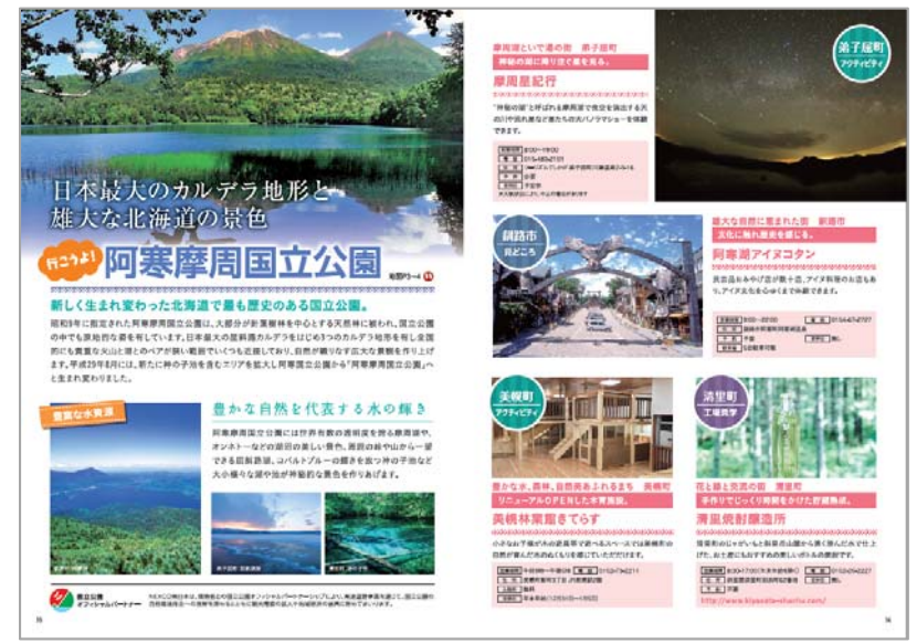
< 阿寒湖周国立公園特集 >