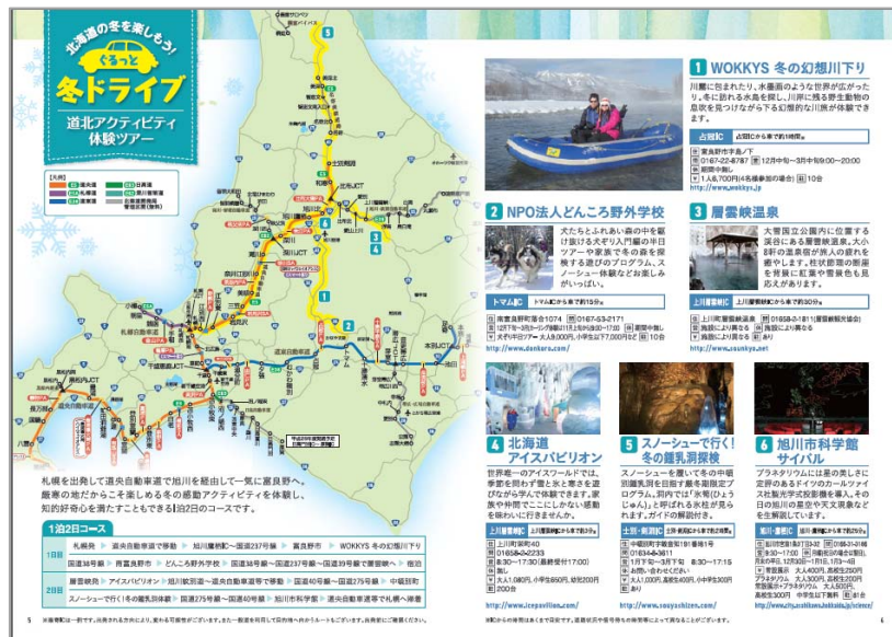
< 周遊ドライブ特集 >