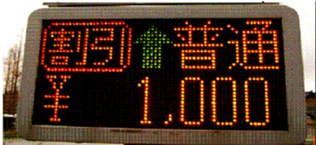
料金所の料金表示器（路側表示器）

休日特別割引を適用して複数の料金をお支払いいただく区間を連続走行した場合に、区間ごとの料金を合算して上限 1,000 円とする措置です。