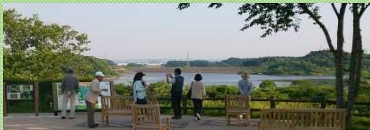
展望広場から化女沼を望む(長者原SA内)

「長者原SAの展望広場」で、「雁のねぐら入り観察会」を開催しております。今年も専門家による解説に加え、レストランシェフが腕を振るった特別メニューをご用意して、皆さまのお越しをお待ちしております。