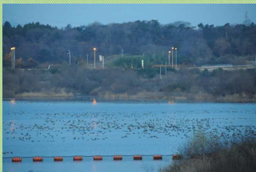
化女沼の雁の群れ