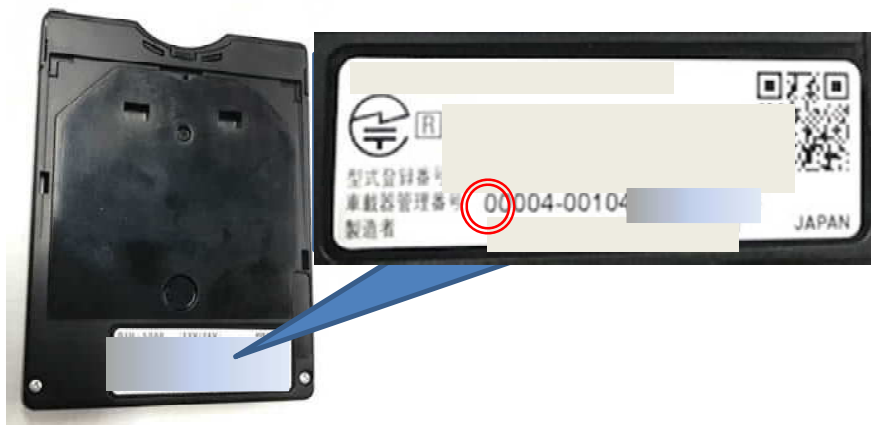
(写真): 旧セキュリティ対応車載器