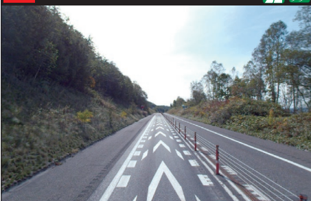
107 E38 道東自動車道：上り