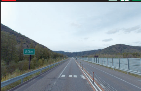
105 E38 道東自動車道：上り