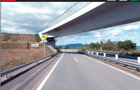
104 E5A 札幌自動車道：上り