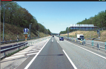
101 E5 道央自動車道：下り