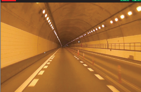
108 E38 道東自動車道：下り