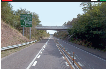
109 E38 道東自動車道：下り