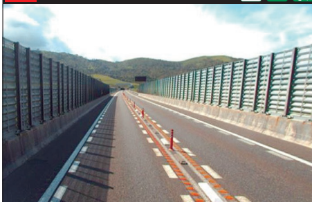
106 E38 道東自動車道：上り