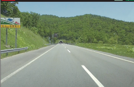
102 E5 道央自動車道：下り