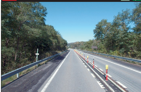
103 E5 道央自動車道：下り