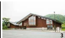
3.道産カラマツ材をふんだんに使った外観 4.3面マルチビジョンの映像で、有珠山噴火を伝える火山科学館の「シアター有珠山噴火」 5.火山科学館には被災車両や曲がったレール(円写真)などを展示