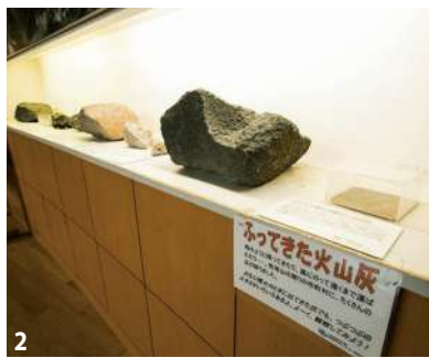
2.洞爺湖の空撮写真が床一面に敷かれたビジターセンターのメインフロア。パネル展示などで洞爺湖の自然が学べる 2.溶岩や噴火の際の軽石なども展示。触って重さを確かめることもできる