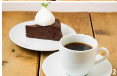
1.サンドイッチの「B・L・T」(¥800)と「自家焙煎コーヒー」(¥400)。食事メニューはドリンク(¥400以下)とセットで¥1,000 2.「ガトーショコラ」(¥450)。飲み物(¥400以下)とのセットは¥700

札幌市街から国道12号・274号(札幌新道)などを経由し、札幌南ICより道央道上り線(函館方面)へ入る。約139km先の虻田洞爺湖ICを降り、国道230号を洞爺湖方面へ約2km、道道2号との交差点を右折し、道なりに約2kmで「洞爺湖」へ。湖畔散歩の際は周辺の無料公共駐車場を利用