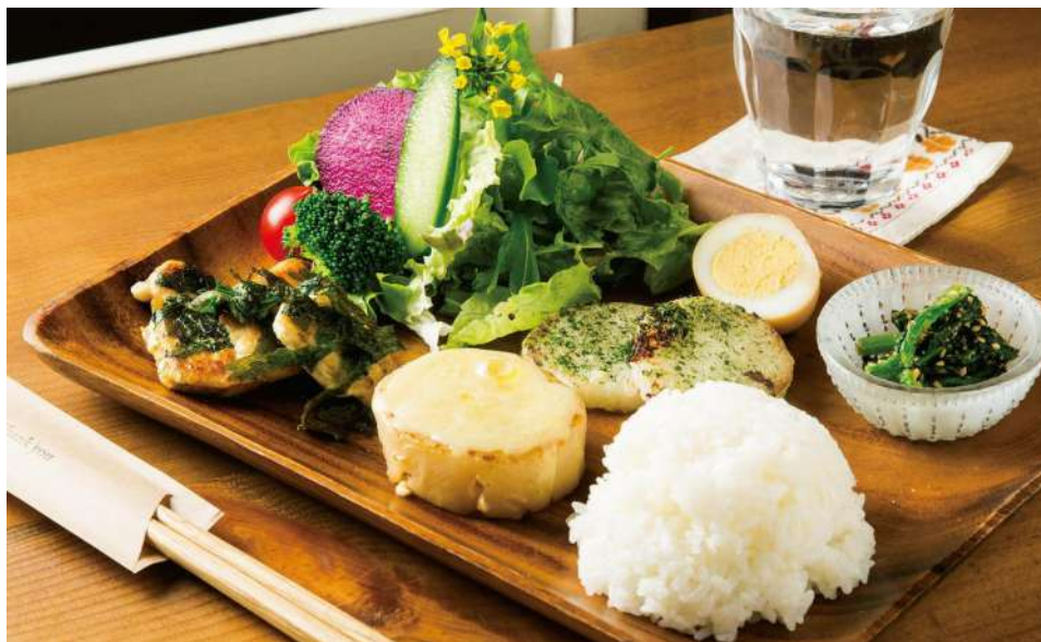
洞爺周辺産の季節の野菜をふんだんに使ったおかず、肉か魚料理1品が付く「日替わりランチB」(¥900)

1.白壁の店内は、手作り感のあるゆったりなごめる雰囲気 2.古い商店の一角を改装し、19年4月にオープン