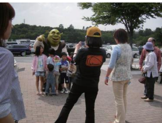
■ イベントブースでの撮影会

本誌への出稿にあわせNEXCO東日本管轄のSA・PA施設内外での商品サンプリング、展示イベント、施設内外でのポスター、サイネージ、ステッカー広告などの連動により、立体的な展開で多方面からアプローチが可能です。