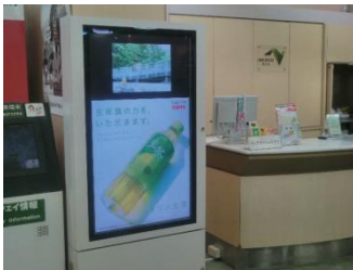
■ デジタルサイネージ