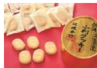
佐渡小判クッキー

世界遺産登録で話題の「佐渡島」にちなんだお土産をSA・PAで販売する「トキめけ！佐渡フェア」が今年も開催！