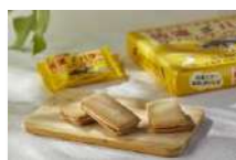
佐渡バタークリームサンド