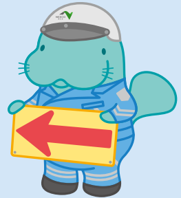
NEXCO東日本 マナーアップキャラクター 「マナーディ」

札幌市厚別区大谷地西5-12-30 東日本高速道路株式会社北海道支社 北海道ドライブガイド アンケート係