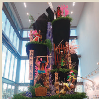
土崎みなと歴史伝承館 [C-2]

高さ143mの港のシンボル。地上100mの展望台は日本海や市街地を一望できる。入館料/無料 ㊟018-857-3381