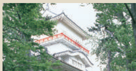
千秋公園・久保田城跡 [C-2]

クジラの骨の標本や、縄文時代の竪穴住居など、ユニークな展示で歴史や自然が学べる総合博物館。近・現代に活躍した秋田ゆかりの人物を紹介する「秋田の先覚記念室」、江戸時代の秋田の様子を記録した菅江真澄の研究拠点「菅江真澄資料センター」、体験型展示室の「わくわくたんけん室」等もある。㊟018-873-4121