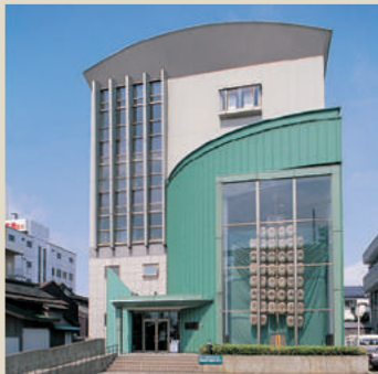
秋田市民俗芸能伝承館(わぶり流し館) [C-2]

竿燈をはじめ、梵天祭や秋田万歳など秋田に古くから伝わる行事や民俗芸能の展示がされている。観覧者が竿燈に触れ、チャレンジもできる。開館時間/9:30~16:30 観覧料/大人100円 高校生以下無料 ㊟018-866-7091