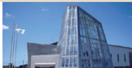
フレライト子ども科学館 [E-2]

鳥海山北側に広がる大草原。標高約500mの草原には風車が回り、男鹿半島や日本海を見渡せるパノラマが広がる。真正面に鳥海山がそびえ、美しい自然を堪能できる。