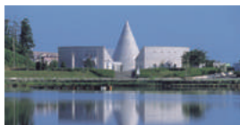
白瀬南極探検隊記念館 [E-2]

地元出身のTDK創始者斎藤憲三氏の生誕100年を記念して作られた、楽しみながら科学を学べる施設。㊟0184-32-3150