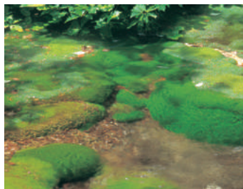
獅子ヶ鼻湿原鳥海マリモ [E-2]

日本の滝百選にも選ばれている名瀑。鳥海山を源流としながら、その山頂に対峙して落下する滝は全国でも珍しい。長さ100m、落差57.4mの勇壮な姿は見応えあり。