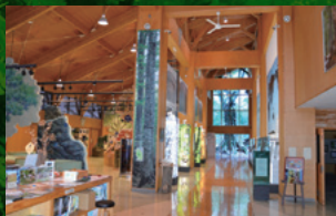
白神山地世界遺産センター「藤里館」[A-3]

カフェ・レンタルスペースの提供や様々なイベントを開催。「アジアン能代うどん」はここだけの逸品。能代オリジナル、クラフトビール(4種類)も販売。6月～11月は「マルシェ」も楽しめる。 ◎能代市上町8-21 ☎090-2279-4492