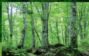
岳岳自然観察教育林 [A-3]

昭和12(1937)年建築の国登録有形文化財。樹齢260年以上の天然秋田杉を天井に配した広さ110畳の大広間は圧巻。 開館時間/9:30～16:30 ※入館無料 休館日/12月29日～1月3日 ◎能代市柳町13-8 ☎0185-55-3355