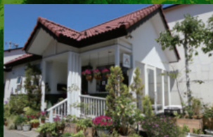
街道カフェ夢工房咲く※咲く [B-2]

秋田県天然記念物に指定されている広さ約18haの天然秋田杉の美林。日本一背の高い天然秋田杉「きみまち杉」(樹高約58m)を有する。保護林入口の100mほど手前に、無料駐車場とお手洗いがある。