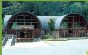
八森ぶなっコランド [A-2]

広さ約12haの林の中に約1.7kmの整備された遊歩道があり、アップダウンが少なく気軽に散策を楽しむことができる。道幅が狭くカーブが多いので、運転には注意が必要。 (注)