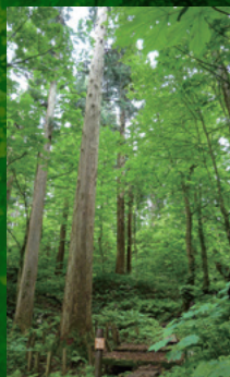
仁鮎水沢スギ 希少個体群 保護林 [B-3]

秋田県天然記念物に指定されている広さ約18haの天然秋田杉の美林。日本一背の高い天然秋田杉「きみまち杉」(樹高約58m)を有する。保護林入口の100mほど手前に、無料駐車場とお手洗いがある。