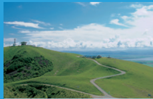
寒風山回転展望台 [C-1]

ホッキョクグマや秋田県の県魚「ハタハタ」など400種類1万点の生きものを展示する。営業時間／9時～17時（最終入館16時）※季節により変動あり ◎☎0185-32-2221