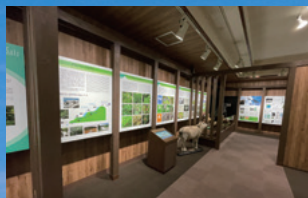
鉾立ビクターセンター [F-2]

鳥海山の5合目にあり、写真やパネル等を使って鳥海山の成り立ち、生息動物や高山植物などを紹介している。