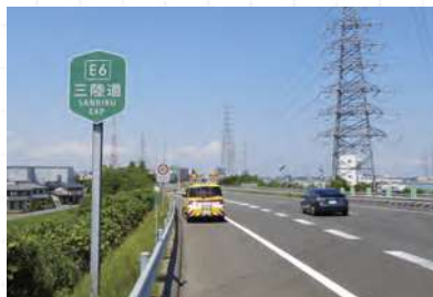
E6三陸道(起点)仙台港北IC付近

③ 三陸自動車道は、仙台港北ICから田老北IC(岩手県宮古市)に至る延長248.1kmの自動車専用道路です。東日本大震災で大きな被害のあった三陸沿岸地域を主に通過しています。ナンバリング(すべての高速道路利用者にわかりやすい道案内のための路線番号)は、仙台港北IC～利府JCT間が「E6」、利府JCT以北が「E45」とふたつ割当てられています。道路を管理するのは、NEXCO東日本の他に、国土交通省、宮城県道路公社が行っています。なお、鳴瀬奥松島IC以北の区間は、通行料が無料ですのでドライブ計画の参考にしてみてはいかがでしょうか。