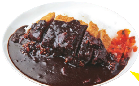
ブラックカツカレー (生野菜サラダ付) ¥920

道内SA・PAで最も広い店舗面積を誇る輪厚PA。道東道へのアクセスが便利のため、ショッピングコーナーでは、地元の北広島市近郊はもとより、道東地方の産品も取りそろえている。 真つ黒なルーが衝撃的なブラックカツカレーは、ボリューム満点の名物メニュー。上り線で昨年から提供を開始した道産鶏の彩丼 も、徐々に人気が高まっている。有人のインフォメーションコーナーがあったり、季節の産直野菜や加工品が並ぶ野菜市場が併設されていたりと、道内他店にないサービスや施設が用意されているのも大きな特徴。上り店のみの輪厚の納屋、下り店のみのキーコーヒーカウンターは、スマートICを活用して行き来すると便利だ。