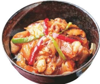
道産鶏の彩丼 (味噌汁・漬物付) ¥750※上り店のみ