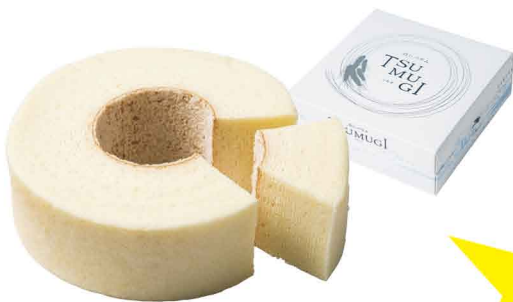
白いバウム TSUMUGI ¥1,296(1ホール)

ショッピングコーナーには、北海道銘菓はもちろん、小樽「銀の鐘」やニセコ町「高橋牧場」の商品をはじめとした後志みやげが充実。ホットスナックとして用意しているカレーパンは、3分ほど待てば揚げたても購入できる。これからのレジャーシーズン、後志方面へのドライブ途中にぜひ立ち寄ってみよう。