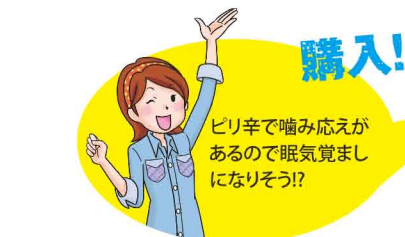
辛口堅めベビースタードライラーメン ¥390(170g)

おなじみのスナック菓子の高速道路限定版。スパイシーチキン味で、気軽につまみやすく、手が汚れにくい点も好評です