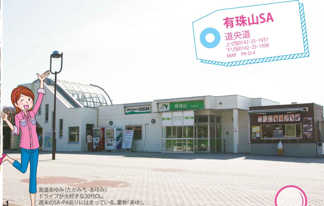
1 高道あゆみ(たかみち・あゆみ) ドライブが大好きな20代OL。 週末のSA・PA巡りにはまっている。愛称「あゆ」。

1.上り店にはガラス張りのアーチ形屋根を備えた展望所(写真左)がある 2.上下線ともスナックコーナーから内浦湾を一望 3.スタッフが工夫をこらした商品POPや、時季に合わせた店内装飾にも注目を