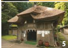
4.「泣ぐ子はいねが」とドスのきいた声で叫びながら、家中を暴れ回るなまはげは迫力満点 5.男鹿の典型的な曲り家を活用した「男鹿真山伝承館」