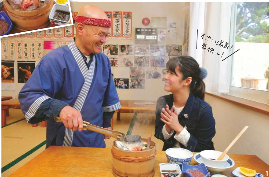
1.「石焼御膳」¥2,160。真鯛などの魚介が入った桶に、熱した石を目の前で放り込んで調理してくれる。目、耳、舌で楽しめる料理だ 2.一番人気「時空を超えた海鮮丼」¥2,160 3.海食崖のパノラマが訪れる人を魅了する入道崎