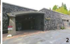
1.男鹿市内60地区・150枚のなまはげ面を集めた展示が圧巻の「なまはげ館」。なまはげの面や衣装を着用できるコーナーも人気 2.男鹿石を用いた外観 3.週3～4日、なまはげ面彫師・石川千秋さんの実演も