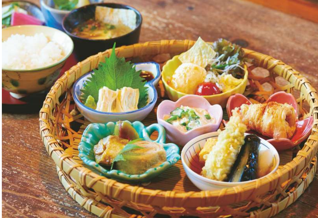
「湯波」の小鉢6種が付く「田舎ゆば膳」¥1,922。ピリ辛醤油で味付けし揚げた「げんこつゆば」は同店オリジナル