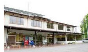
中心街から少し離 れた場所にあり閑 静なたたずまい