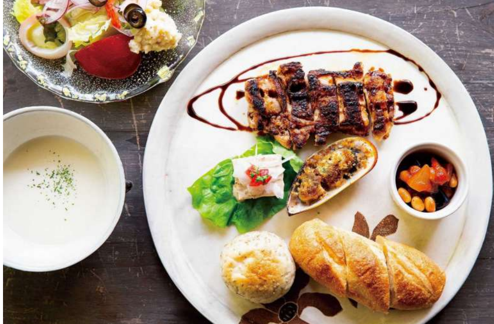
地産の食材をふんだんに使用した「フーネプレート」 ¥1,650は、サラダとスープがセットで大満足

〒栃木県芳賀郡益子町益子5196 ☎0285・81・6004 ☒11:00～16:00(L015:30) ☎☎ ☎24席(禁煙) ☒10台(無料)