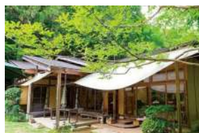
古民家風の建物が周囲の景観にマ ッチ。庭にはテラス席が完備