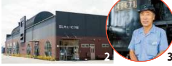
1. 北海道内の急行列車に使用されていた急行用客車スハフ4425号。防寒のため二重窓になっている 2. SLの外観を模した印象的な建物 3. 4代目館長の長津光男さん