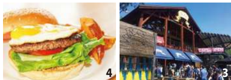
3. レストラン併設のウッディなセンターハウス 4. レストランでは「JOJO'Sオリジナルバーガー」(¥1,280)などが味わえる

☎倶知安町山田179-53 ☎0136-23-2093 ☎8:00~21:00、レストラン9:30~ ※体験は予約制。体験時間はメニューにより異なる。詳細は☎www.nac.adventures.jpを参照 困なし ☎ラフティング大人¥6,156、小学生¥4,104、NACアドベンチャーパーク大人¥4,860、小学生以下¥4,104ほか 圏100台(無料)