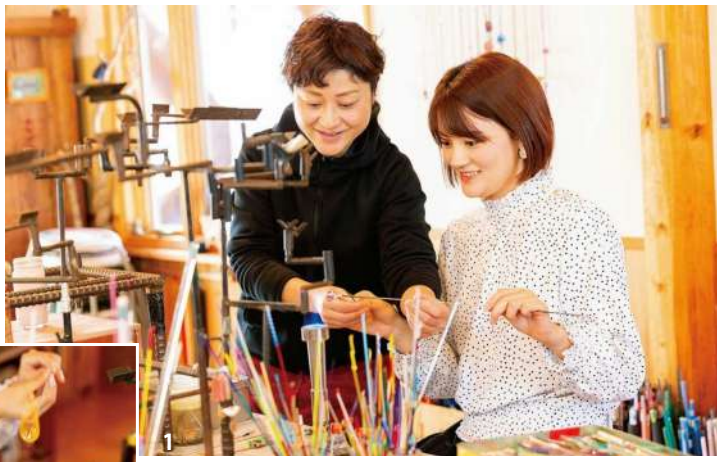
1・2.ガラスは300色以上から好きな色をチョイス。約2時間スタッフに丁寧に教えてもらいながらガラスを溶かし、とんぼ玉を作っていく 3.世界に一つだけのアクセサリが完成