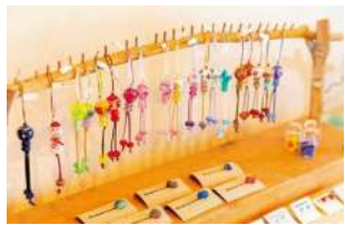
色とりどりのかわいいストラップ¥1,100 ~などのアクセサリも販売

☑長野県下高井郡木島平村上木島3278-46 ☎0269-82-1821 ☒10:00~17:00(最終受付16:00) ☒不定 ☒とんぼ玉体験¥2,500(材料費込み・予約優先) ☒10台(無料)