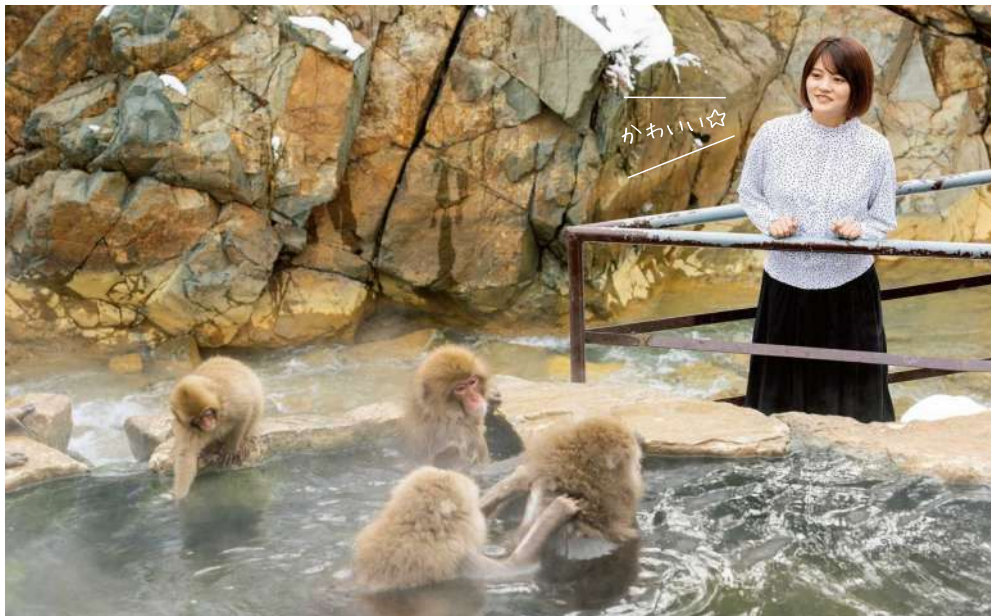
苑内にあるサルが入る露天風呂。ニホンザルたちが続々と湯につかりに来てリラックスした表情を見せてくれる

〒478-0269 長野県下高井郡山ノ内町平穏6845 ☎0269-33-4379 🕒9:00ごろ～16:00ごろ(11～3月)、8:30ごろ～17:00ごろ(4～10月)※時間はおおむねの目安 👤困なし ㊟入苑料18歳以上¥800、小学生・中学生・高校生¥400 🚌回約30台(無料)