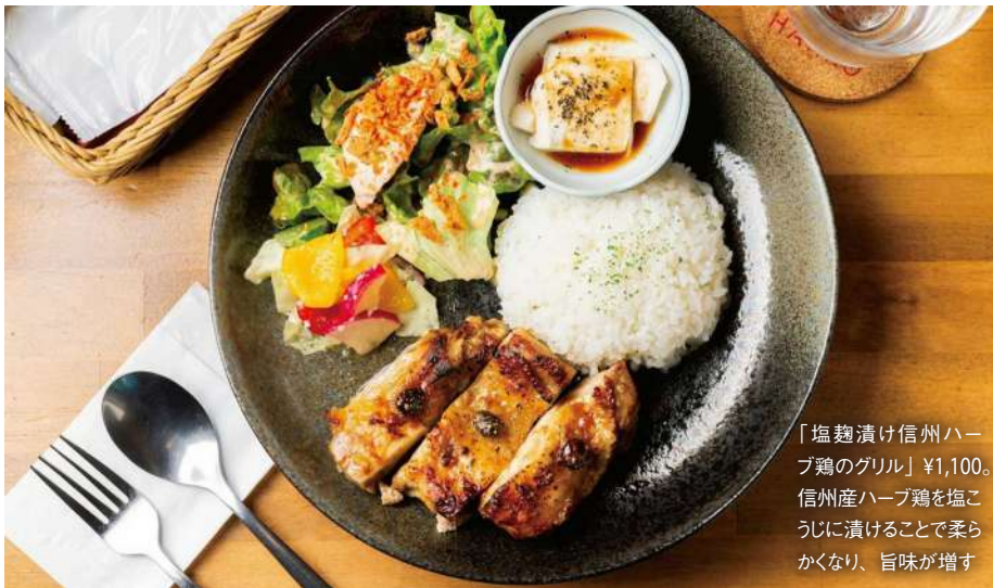
「塩麹漬け信州ハーブ鶏のグリル」¥1,100。 信州産ハーブ鶏を塩こうじに漬けることで柔らかくなり、旨味が増す

〒478-0310 長野県下高井郡山ノ内町平穏3010 ☎0269-38-8500 🕒11:30～14:30(LO)、18:00～22:30(LO) 👤困① ㊟38席(分煙) ㊟4台(無料)