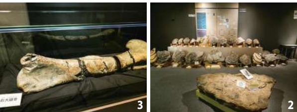
1.クビナガリュウの復元模型 2.二枚貝イノセラムスの化石 3.むかわ竜の化石はその一部、右大腿骨(写真)と尾椎を展示。本物のむかわ竜の化石を常設するのは、国内でも同館だけだ

世界的な化石はもちろんな 名物グルメも楽しみ！ 4月のおでかけは、道東道を利用して春間近の厚真・むかわエリアへ。まずはむかわ穂別ICから、むかわ竜で一躍有名になった「むかわ町穂別博物館」(写真上)へ向かい、ここでしか見られない貴重な化石を観賞。昼食はむかわ市街まで車を走らせ、「大豊寿司」でにぎりとししゃま料理を味わいたい。食後は「カネダイ大野商店」に立ち寄り、特産のシシャモを購入。店内で焼きたてのシシャモを味わうのもおすすめです。お次は厚真町へ行き、隠れ家カフェ「momo cafe」の、手作りケーキと紅茶でほっとひと息。最後は「こぶしの湯あつま」の露天風呂で汗を流して帰路へ。