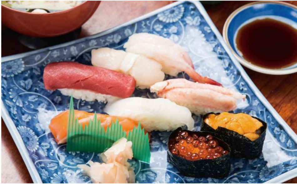
ウニやイクラ、カニなど豪華なネタが並ぶ「にぎり特中」(¥2,000)。にぎりは並¥1,200 ～と良心的な価格設定